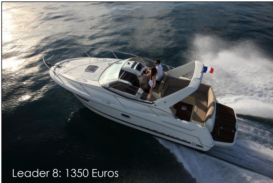
Leader 8: 1350 Euros