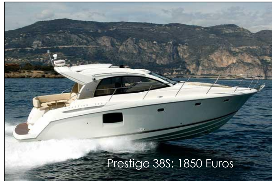
Prestige 38S: 1850 Euros