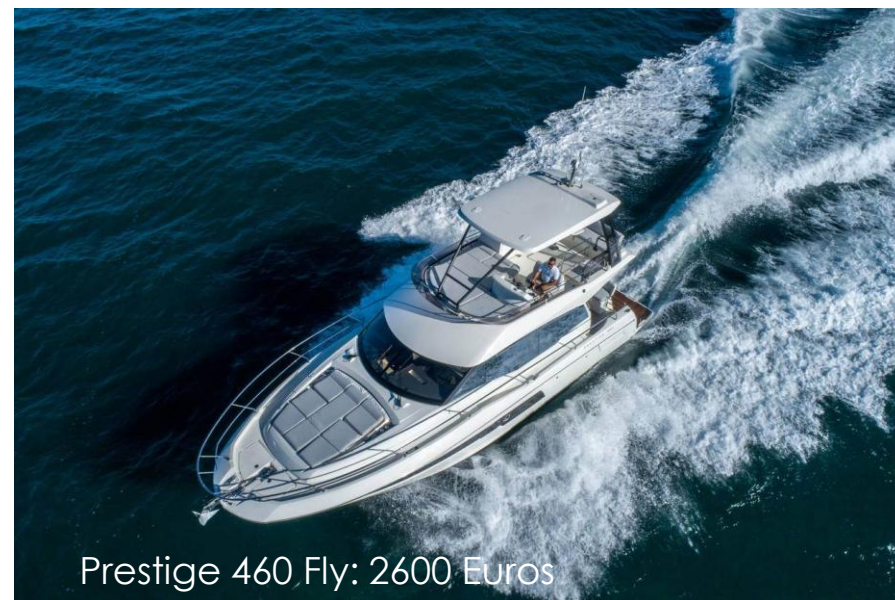
Prestige 460 Fly: 2600 Euros