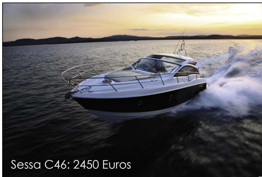
Sessa C46: 2450 Euros